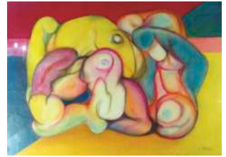
Lot 3: Elga Maly, Ohne Titel, Mischtechnik, 44 x 62cm, € 300,-