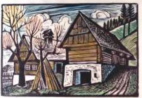
Lot 16: Franz Weiß, Leitenbauer, Farbholzschnitt, Passepartoutausschnitt ca. 37,5 x 51,5cm € 200,-