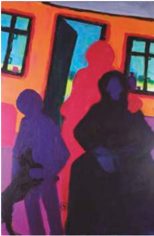
Lot 15: Robert Hammerstiel, Interieur mit drei Gestalten, Tisch und Hund, Acryl/ Lw., 2016, 90 x 60cm € 2.500,-