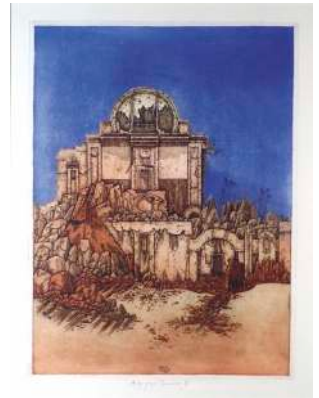
Lot 6: Gregor Traversa, An der Schwelle, Farbradierung, 1998, 58 x 45cm, € 250,-