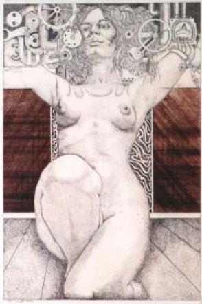
Lot 1: Gregor Traversa, Machine Girl 1, Radierung, 1971, 51 x 40cm, € 200,-