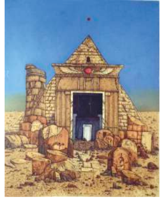
Lot 12: Gregor Traversa, Beschenkt mit Leben, Farbradierung, 2003, 60 x 50cm, € 250,-