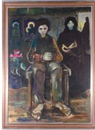
Lot 10: Robert Hammerstiel, Sitzender Knabe mit lesende(r) alter Frau, 1969, Nr. 462, ca. 70 x 50,5cm € 3.000,-