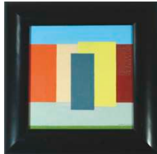
Lot 5: Günter Waldorf, Landschaft mit Objekten, Öl/ Leinwand, 22 x 22cm € 1.000,-