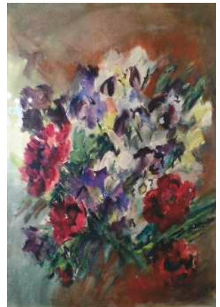
Lot 7: Edith Naske, Pfingstrosen, Mischtechnik/Papier, Passepartoutausschnitt ca. 78 x 54cm, € 500,-