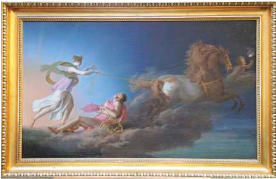
Aurora weckt Morpheus, Frankreich Ende 18. Jahrhundert