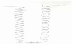
Lot 13: Gerhard Rühm, Eingang, Siebdruck, 39/50, 1986, Passepartoutausschnitt ca. 29x 39cm € 120,-