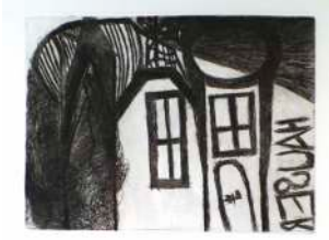
Lot 9: Johann Hauser, Radierung (Probedruck), 1970er, Passepartoutausschnitt ca. 39 x 29cm, € 500,-