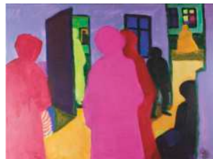
Lot 8: Robert Hammerstiel, Nachricht am Morgen Oktober 1944, Acryl / Leinen, 2017, 60 x 80cm € 2.500,-