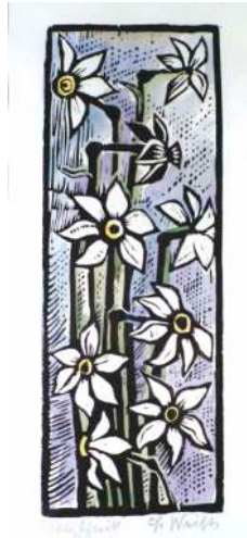
Lot 11: Franz Weiß, Blumen- stillleben, Holzschnitt, Passepartoutausschnitt ca. 38 x 16,5cm € 100,-