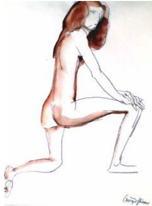
Lot 2: Werner Augustiner, Akt, Aquarellierte Kohle, Passepartoutausschnitt ca. 39 x 29cm € 200,-