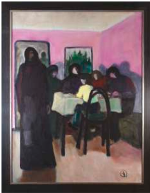
Lot 4: Robert Hammerstiel, Am Tisch, Acryl / Platte, 1973, WVZ Nr. HA1100, 85,5 x 65cm € 2.500,-